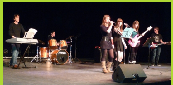
Le groupe « ZIC-ZAC », en nous proposant des musiques actuelles, en a fait danser plus d'un !