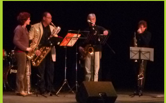
Ici, un quatuor de saxophones.

Lors de l'après-midi du 18 décembre dernier, nous avons eu le plaisir d'assister à une représentation de l'École de Musique de Coulommiers.