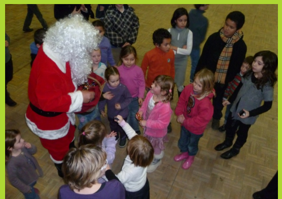
La plus grande surprise fut, pour les enfants, l'arrivée du Père Noël, qui leur a donné quelques friandises en attendant Noël.